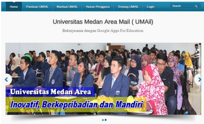
Gambar 1 : Halaman Depan Website UMAIL UMA

Layanan Email UMA dapat diakses melalui alamat umail.uma.ac.id , maka pengguna akan dihadapkan dengan halaman sebagai berikut.